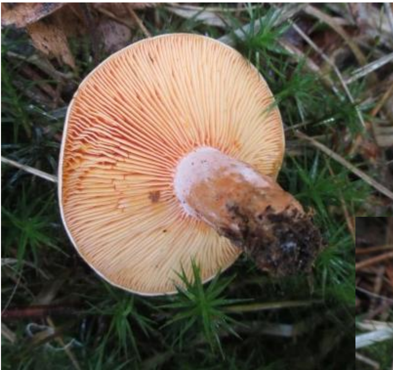
De vaaloranje melkzwam