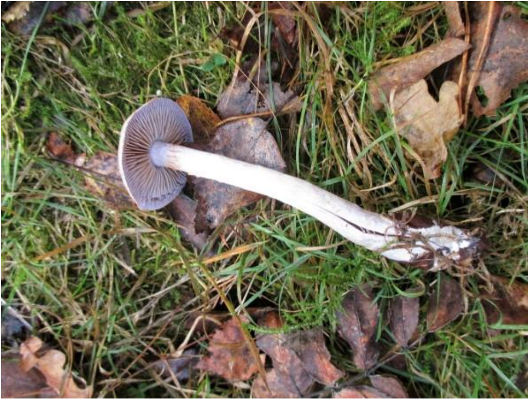
De vaaggeordelde gordijnzwam